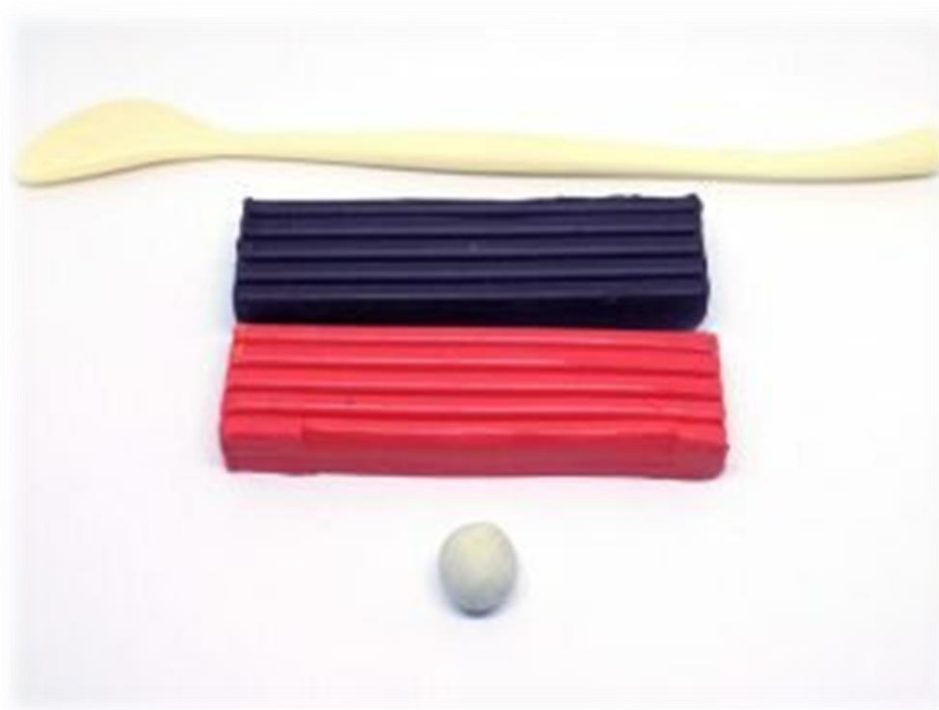
Фото божьей коровки из пластилина

пластилин красного и черного цвета небольшой кусочек белого пластилина стеку